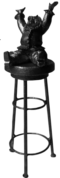
Begehrte Trophäe: Der Oelsnitzer Barhocker